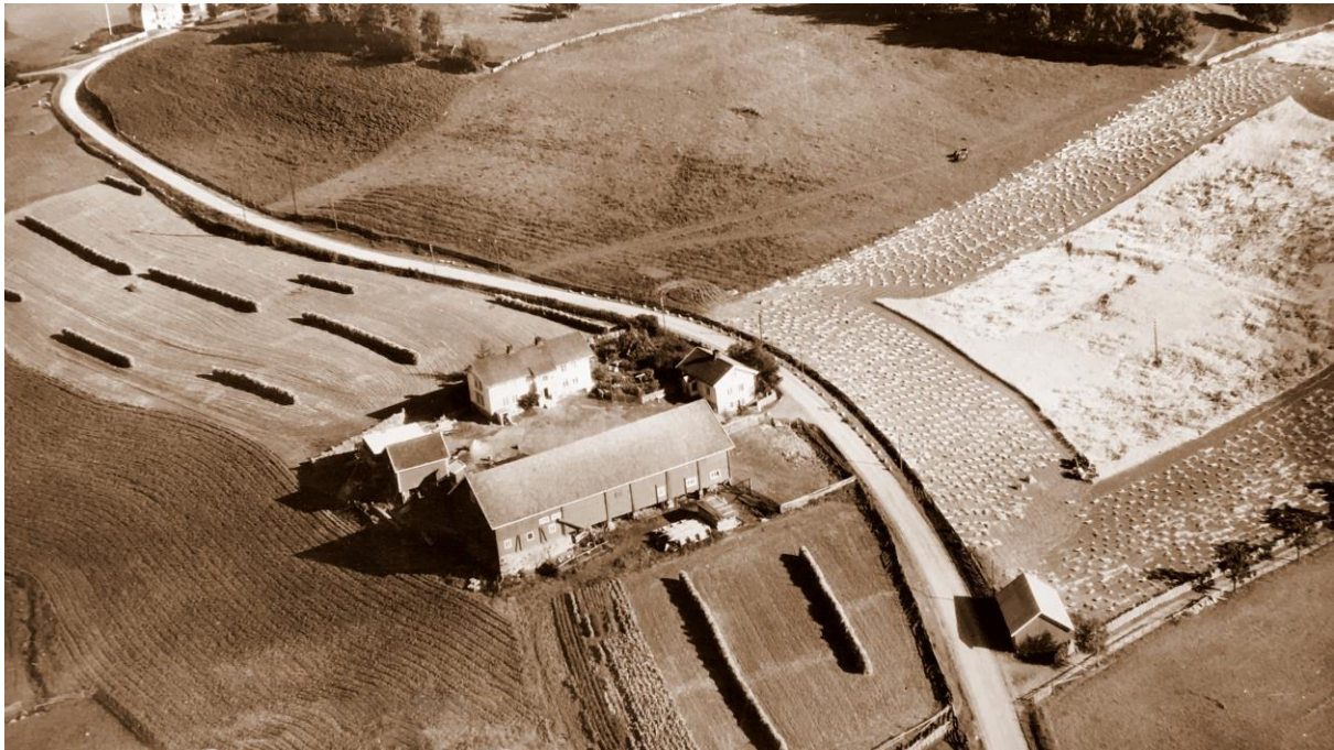
Vøien øvre gnr/bnr 249/1 i Gran

Gardsnavnet betyr iflg. Oluf Ryghs verk Norske Gaardsnavne enga ved vadestedet.