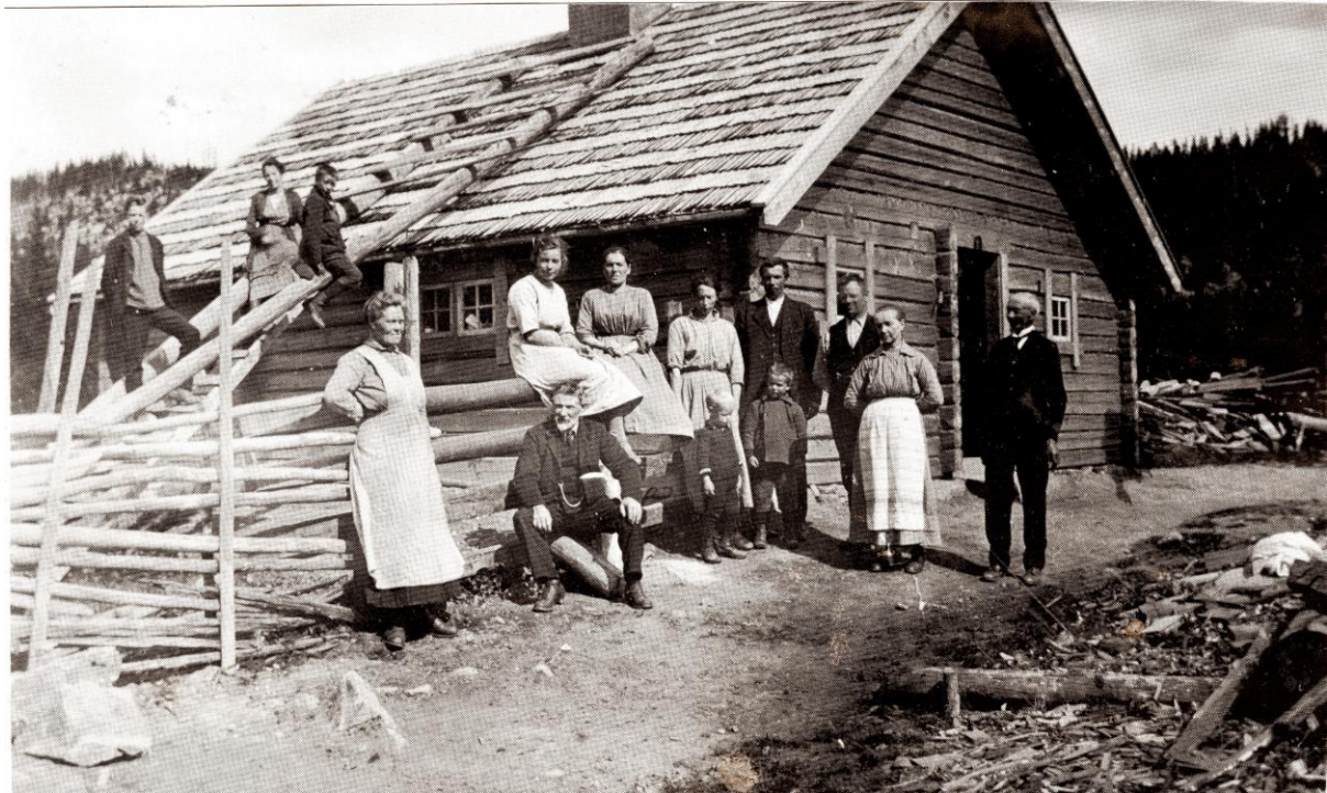
Setra på Øyangen i 1922.