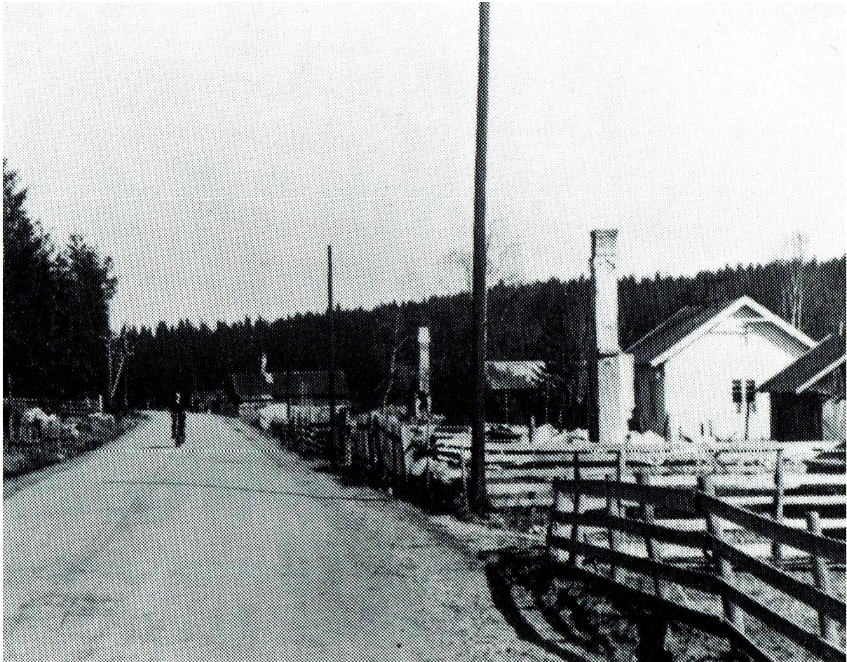
Til sammen 8 hus ble i 1940 offer for krigshandlingene mellom Tobru og Bybrua. Dette er restene etter Øvre og Nedre Bruvoll ved Bybrua.

Ut på ettermiddagen hørte vi et drønn så rutene klirret. Da ble vi redde alle. «Dere to må gå i dekning», sa en av soldatene. Det drønnet minnet om bombing. Jeg tenkte, så sa jeg: «Nei, vi går ikke fra dere. Det der var ei bru som ble sprengt nede i dalen her.» Det visste jeg ikke, men det var akkurat det som skjedde. Vi laget et stort røde korsflagg og la på snøen i hagen.