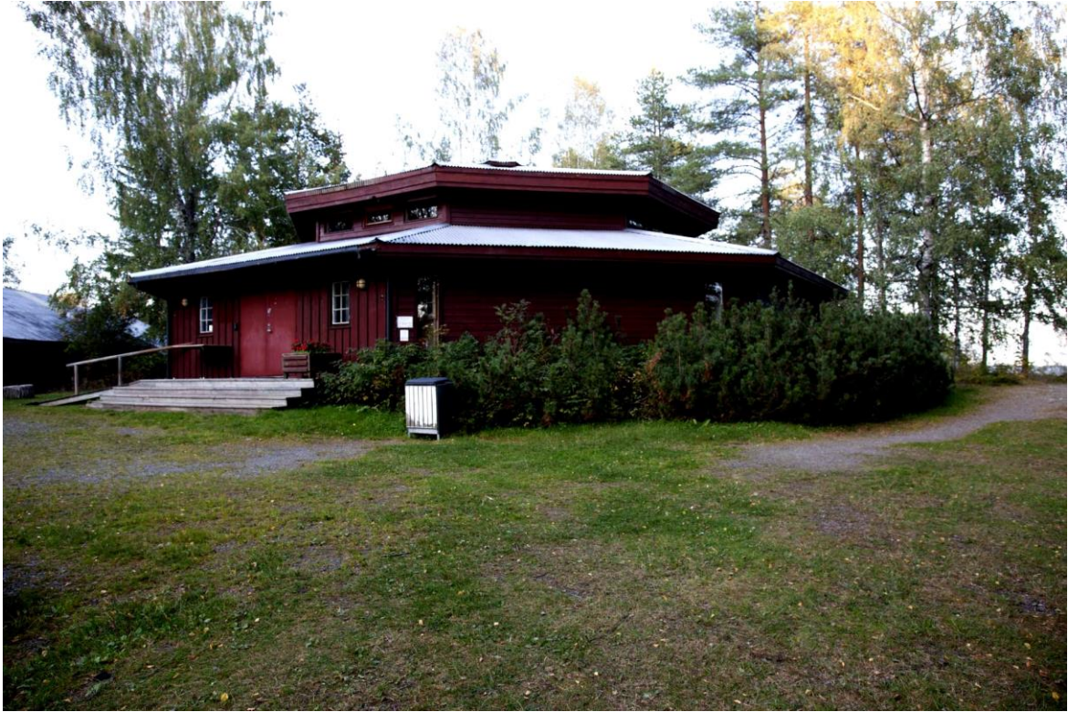
Åttekanten på Eiktunet, bygd i 1976, blir benyttet som utstillingslokale.