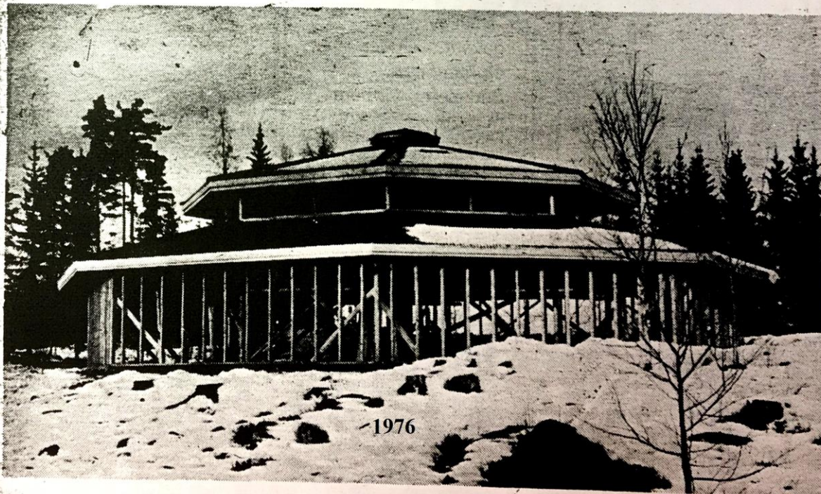
Hallen ligger like ved amfiteateret og skal kunne brukes i samband med det.

og musikkstevner og andre tilstelninger. Museet skal også kunne leie ut hallen og festplassen til stevner hvor det er behov for et stort område omkring. Dansen skal foregå på scenen som ligger like i nærheten av utstillingshallen, og i skråningen mellom har vi sitteplasser til et par tusen mennesker. Eiktunet får faktisk en av de aller største festplassene i hele fylket, sier museumsbestyreren.