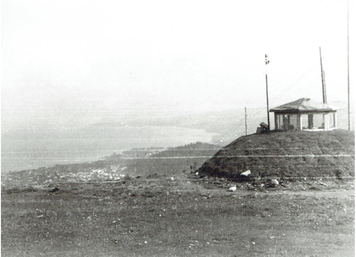
Tyskernes observasjonspost på Bergstoppen