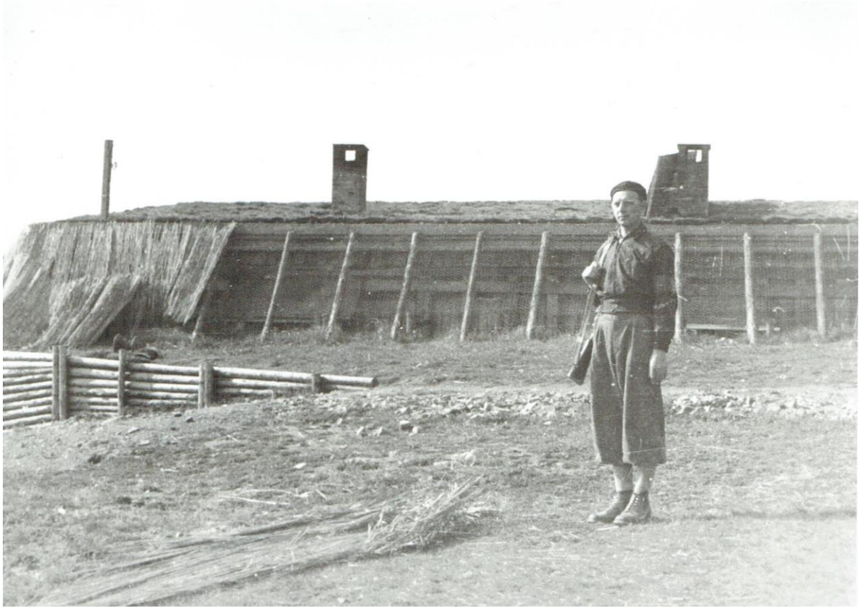
HS-mannskapene har inntatt anlegget på Bergstoppen i april dagene i 1945