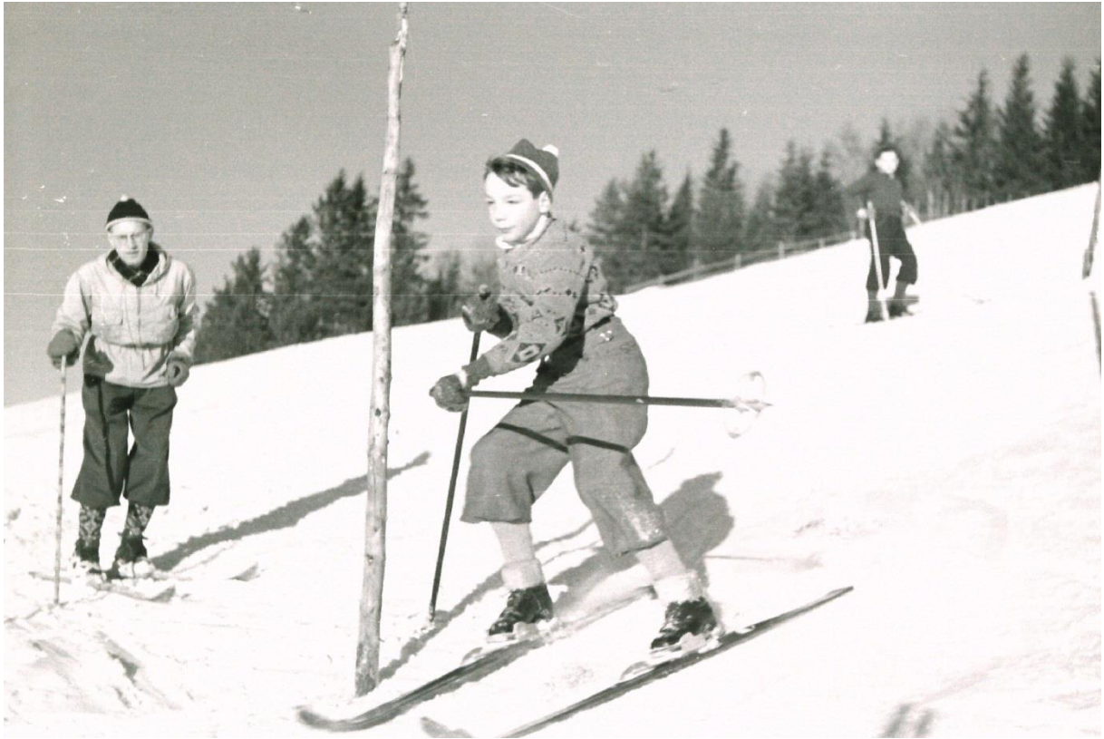
Skitrening i Bergsjordet under krigen