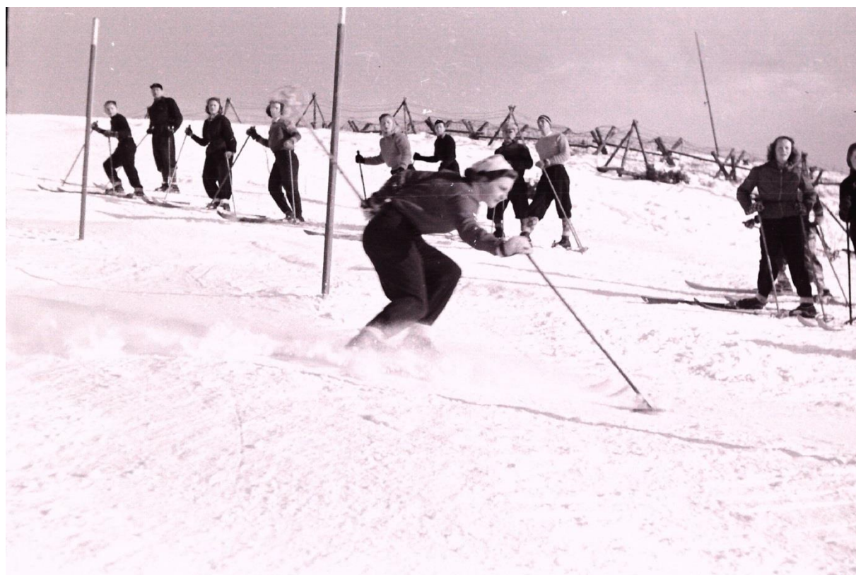
Reidun Løfgren i farten. Dert tyske sperregjerdet ses tydelig i bakgrunnen.