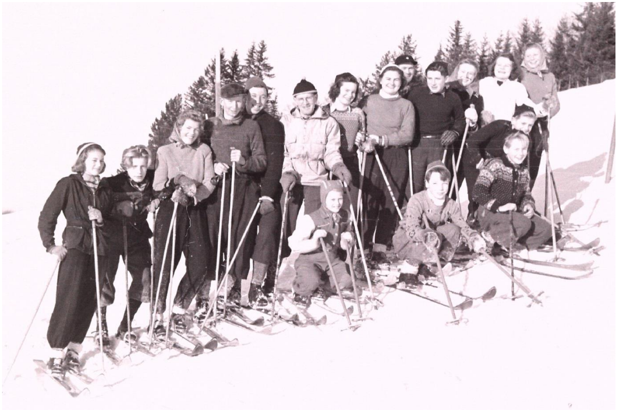
Bildet av kursdeltakerne foreligger i flere versjoner.